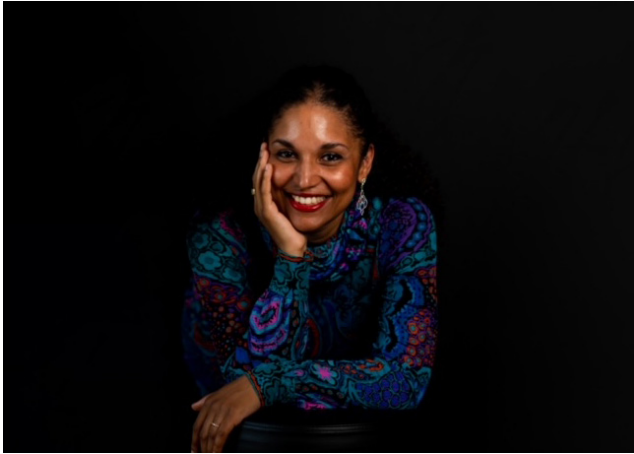
Le piano virtuose Macha Kanza (piano)

Vendredi 12 septembre 2025 Pavillon Indochine — 19h30